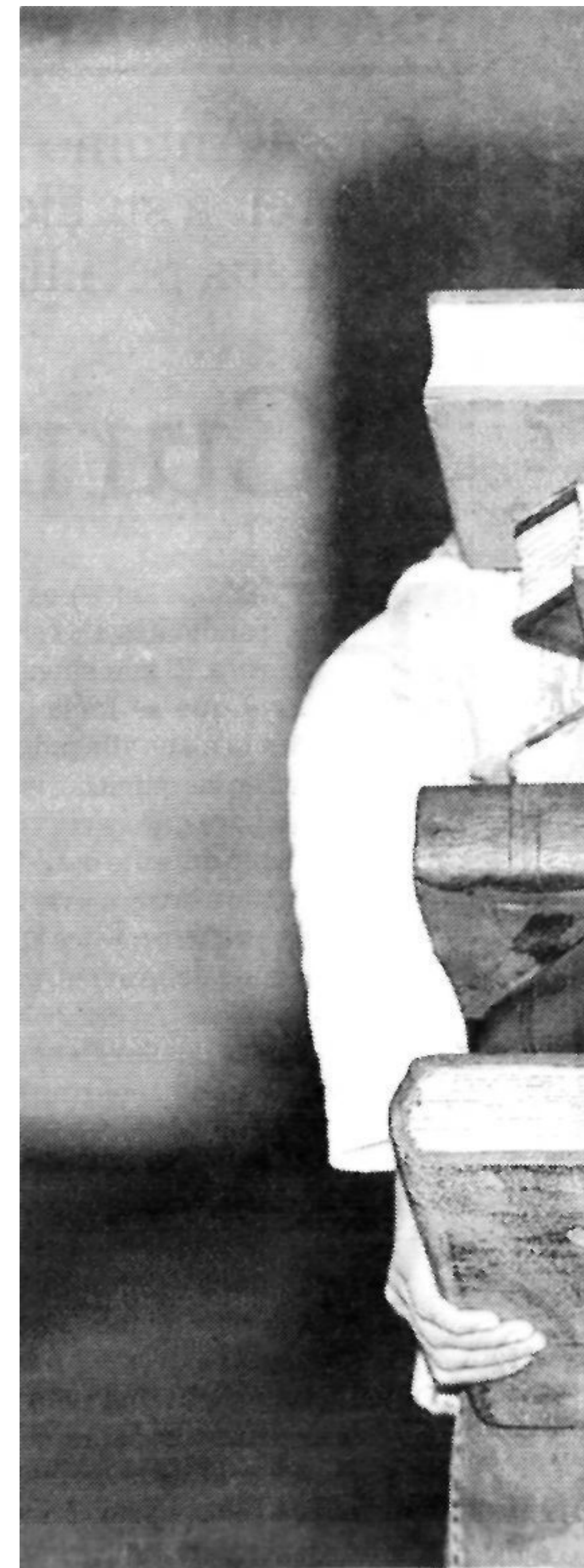
ASIGNATURA PENDIENTE. Otra

¿Qué es lo que falla? Profesores consultados aseguran que el actual sistema educativo no prima el esfuerzo. Eso, unido a la promoción casi automática, la mezcla en la misma aula de alumnos con grandes diferencias de nivel e interés han contribuido a agrandar